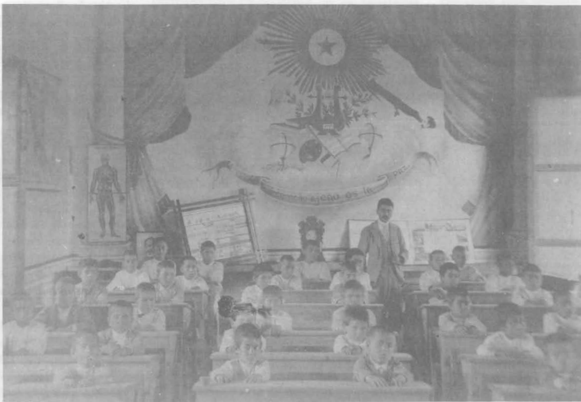
Interior de un salón de clases, Puebla, 1899.

del director, personal y profesores; solicitudes de empleo; inscripción de alumnos; Ley de Exámenes Generales, concesiones de exámenes extraordinarios.