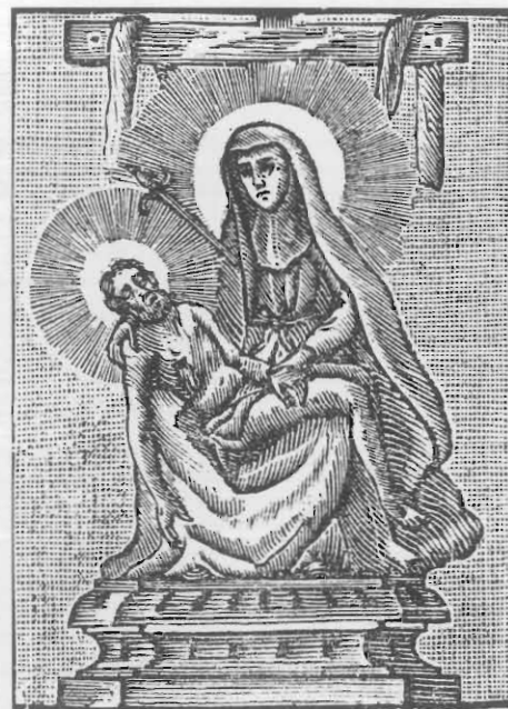
"Piedad", 1772. Historia, vol. 157, f. 360 (276).