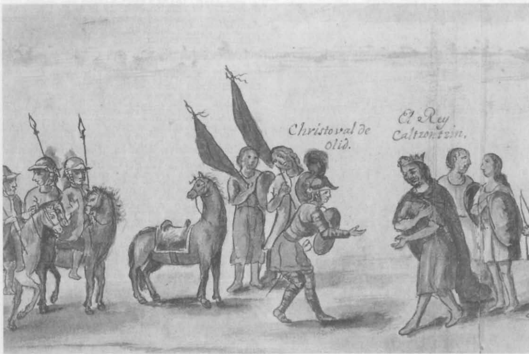
Códice Crónica de Michoacán, copia de 1792. Historia, vol. 9, cap. 2, f. 15 (204) (detalle).