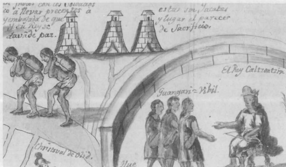
Códice Crónica de Michoacán, copia de 1792. Historia, vol. 9, cap. 2, f. 15 (203) (detalle).

Memorias para la Historia de América Septentrional . Incluye copias del siglo XVIII de: la Crónica de Michoacán, de fray Pablo Beaumont; Crónicas mexicanas, de Hernando Alvarado Tezozómoc; La historia chichimeca, de Fernando de Alva Ixtlilóchitl; descripciones de la Nueva España y de la ciudad de México. Noticias del Establecimiento de Ordenes Religiosas : franciscanos, mercedarios, jesuitas, dominicos y agustinos. Fundación de Conventos : San Diego, San Lázaro, Las Huertas, San Fernando, Santa Clara y Santa Catalina, entre otros. Fundación de Colegios : San Gregorio, San Andrés, San Ildefonso, Santa Cruz, Santiago y otros; en la memoria para la historia de Sonora, California, Nueva Vizcaya, Nuevo México, Texas, Coahuila, Nuevo Reino de León y Zacatecas se encuentra abundante información sacada de las cartas annuas de la labor misional de los jesuitas y también de las misiones de franciscanos y dominicos. Existe mucha documentación acerca de las Provincias Internas : exploraciones, fundación de misiones,