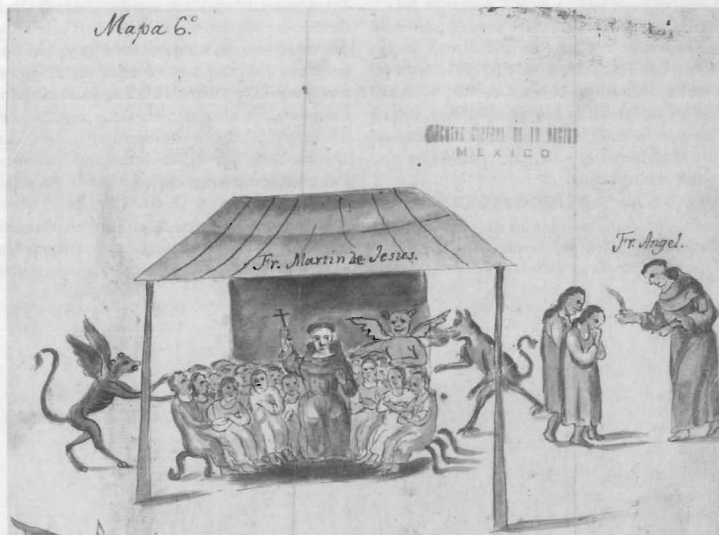
Códice Crónica de Michoacán, copia de 1792. Historia, vol. 9, cap. 17, f. 148 (206) (detalle).

Epidemias (viruela) (1795-1816). Reglamento referente al modo de distribuir la vacuna, por Francisco de Balmis, en navíos con virulentos; medidas para evitar la propagación; solicitudes para que se administre la vacuna en las intendencias; listas de vacunados; casos de viruela en Tehuantepec y Teutilán.